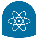
Domo de contención nuclear

Dentro y alrededor del reactor hay varias capas de barreras físicas para evitar una liberación accidental de radiación. Estas barreras incluyen: las barras de combustible que envuelven el material nuclear, el reactor que contiene esas barras, y el edificio de concreto reforzado con acero donde está instalado el reactor.